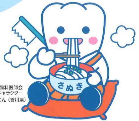
日本歯科医師会 PRキャラクター よ坊さん(香川県)

なんでも美味しそうに食べる人や 口元に清潔感のある人って健康なイメージですよね。 でも、それにはちゃんとわけがあるんです。 実はお口の健康はお口だけじゃなく 全身の健康にも大きく関係しています。 今回の公開講座ではお口の健康と身体の健康の関係について、 また、お口の健康を保つためにはどうすればよいのかを、 わかりやすくお話させていただきます。